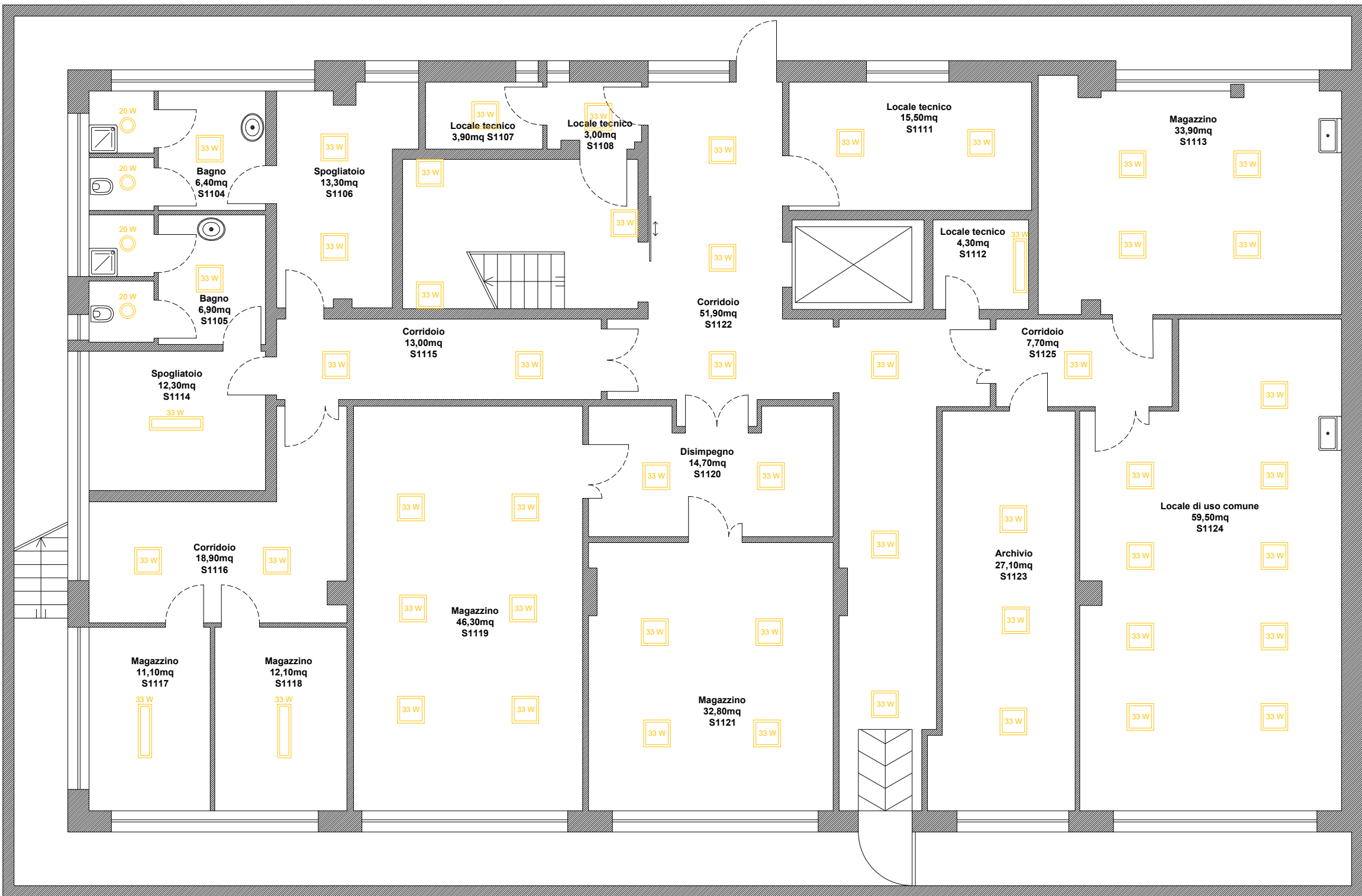
Stato di Progetto Pianta Livello S1 Scala 1:100